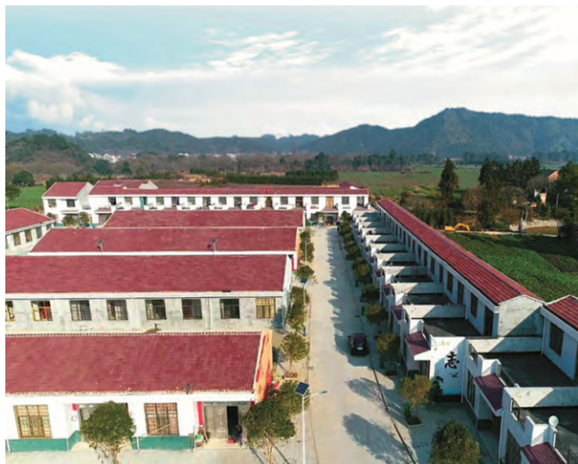
茶陵县湖口镇厂江村幸福安居工程

健康扶贫“分类救治”模式，保障贫困户基本健康需求。因病致贫是目前剩余贫困人口中主要的致贫原因之一。疾病与贫困之间的关系密不可分：低收入人口往往面临着有病治不起、小病拖成大病的问题，这不仅会造成家庭的灾难性医疗支出，还会降低患病者的劳动能力，从而更加重了家庭的负担。为了保障建档立卡人口得到充分的救治，株洲市在全